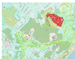
Figura 2 – Alto da Nação

Dados Comerciais: São 940 ligações de água, sendo dessas 668 efetivamente ligadas (71%) e 194 Inativas e Cortadas (39%). Cerca de 234 ligações de água estão situadas em área considerada Aglomerado Subnormal (Alto da Nação: 234 ligações de água, 37% Inativas e Cortadas):