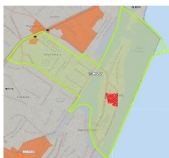
Figura 2 – Favela do Rato

Dados Comerciais: São 872 ligações de água, sendo dessas 400 efetivamente ligadas (45,8%) e 473 Inativas e Cortadas (54,2%). Cerca de 373 ligações de água estão situadas em áreas consideradas Aglomerados Subnormais (Favela do Rato: 373 ligações de água, 60% Inativas e Cortadas):