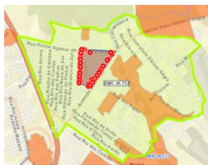
Figura 1 – Lagoa da Conquista

Dados Comerciais: São 5.215 ligações de água, sendo dessas 2.268 efetivamente ligadas (43%) e 2.947 Inativas e Cortadas (57%). Cerca de 856 ligações de água estão situadas em áreas consideradas Aglomerados Subnormais (As duas maiores áreas são Lagoa da Conquista: 88 ligações de água - 53% Inativas e Cortadas e Malaço: 608 ligações de água – 43% Inativas ou Cortadas):