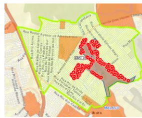
Figura 2 – Malaço