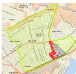
Figura 2 - Chié Ilha

Dados Comerciais: São 9.362 ligações de água, sendo dessas 6.889 efetivamente ligadas (73,5%) e 2.473 Inativas e Cortadas (26,4%). Cerca de 1.530 ligações de água estão situadas em áreas consideradas Aglomerados Subnormais (Chié Ilha: 292 ligações de água, 34% Inativas e Cortadas / Saramandaia – Capilé: 1.238 ligações de água, 38% Inativas e Cortadas):