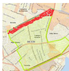
Figura 3 - Saramandaia / Capilé